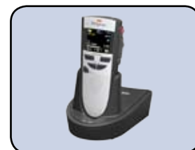
Inclusief Digta Station